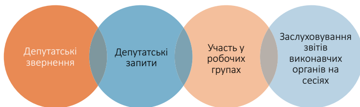
Рис. 5. Інструменти, які можна використовувати для просування соцпослуг

Депутати місцевих рад згідно законодавства мають низку спеціальних інструментів для впливу на соціальну політику своєї громади, а саме (рис. 5).