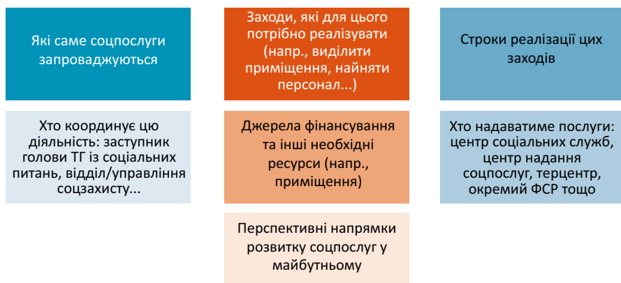
Рис. 1. Складові плану дій щодо запровадження соціальних послуг у громаді

Запровадження соціальних послуг у громаді не є винятком з цього правила. Воно має починатися із розробки плану дій, де буде визначено наступні аспекти (рис. 1).