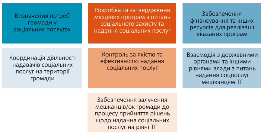
Рис. 4. Повноваження голів територіальних громад щодо рішень у царині впровадження соцпослуг

Таким чином, голова територіальної громади відіграє ключову роль у формуванні та реалізації соціальної політики на місцевому рівні, забезпечені надання якісних та доступних соціальних послуг для всіх мешканців громади.