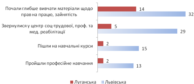
Рис. 3.4. Частки молоді, яка зазначила про здійснені кроки щодо спеціалізованого навчання після участі в тренінгу, за регіонами, %

Понад половину респондентів своїми відповідями фактично підтверджують застосування на практиці набутих на тренінгу комунікативних навичок, долання ментальних бар'єрів, що заважали спілкуванню з однолітками, іншими людьми (рис. 3.5). Найбільш активно розвиваються взаємовідносини в колі учасників тренінгів. Це підкреслювали під час фокус-груп молоді люди, їх батьки, тренери. Причому йдеться не лише про більш активне спілкування у телефонному або електронному режимі, спільну участь у навчальних, спортивних, культурних заходах, які проводяться спеціалізованими НУО, а й про поєднання зусиль задля проходження навчання в центрах соціально-трудової, професійної та медичної реабілітації інвалідів, пошуку робочих місць, обговорення можливостей з відкриття власної справи тощо.