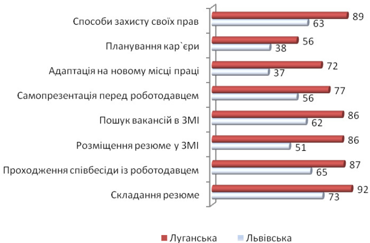
Рис. 3.2. Частки молоді, яка зазначила про здобуття окремих навичок впродовж тренінгів, за регіонами, %

нові навички, що зможуть їм допомогти в пошуку роботи, у т.ч. щодо складання резюме (85%), його розміщення в ЗМІ (73%), проходження співбесіди з роботодавцем (80%), самопрезентації (69%), пошуку вакансій в ЗМІ (77%), способів захисту своїх прав (79%), адаптації на новому місці праці (59%), планування своєї кар'єри (49%). Серед тих, хто не зазначив жодної із практичних навичок, (3%) – 17–25-річні молоді люди лише із Львівської області, які, здебільшого, не брали участі в тренінгу усі дні. За всіма включеними до оцінювання навичками із значним відривом лідирує Луганська область (рис. 3.2).