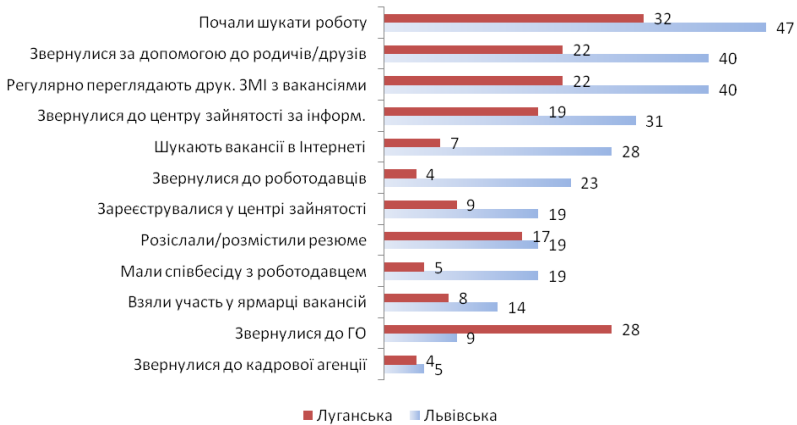
Рис. 3.3. Частки молоді, яка зазначила про здійснені кроки щодо пошуків роботи і працевлаштування, після участі в тренінгу, за регіонами, %

опитаної молоді, більш активно намагалися працевлаштуватися учасники семінарів Львівської області (рис. 3.3). Це цілком прогнозовано, адже серед них понад половина (56%) уже мають професію/спеціальність, у т.ч. вищу освіту 39%. Аналогічні показники для цільової аудиторії Луганської області є помітно нижчими: 47 і 15%. Водночас регіональні порівняння поведінки лише учасників, які уже здобули професії/спеціальності, є за багатьма заходами теж на користь Львівської області (хоча виявлені розбіжності є вже не настільки очевидними, а статистична помилка – надто великою).