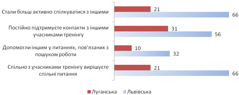
Рис. 3.5. Частки молоді, яка зазначила про розширення кола спілкування після участі в тренінгу, за регіонами, %

Отже, кінцеві результати навчальних заходів, спрямованих на розвиток трудового потенціалу молоді, є дуже позитивними. Адже отримані високі показники покращання знань молоді щодо юридичних та інституційних аспектів у сфері працевлаштування людей з інвалідністю; засвоєння цільовою аудиторією практичних навичок, корисних у пошуку вакансій, працевлаштуванні та соціальній адаптації; здійснення нею конкретних кроків із пошуку роботи та/або підвищення конкурентоспроможності на ринку праці, очевидними є позитивні зміни в світогляді молоді. Водночас слід мати на увазі обмежену чисельність молодих людей, які змогли пройти тренінгові навчання. Нагальною є потреба забезпечити подальший доступ решти бажаючих до засвоєння навчального курсу “Профорієнтація молоді з інвалідністю”. Для цього варто розглянути можливості щодо розширення кола установ, закладів і НУО, які б могли долучитися до організації навчання за зазначеним курсом. Головне – наявність відповідних спеціалістів, їх бажання та довіра до цих установ з боку молодих людей з інвалідністю.