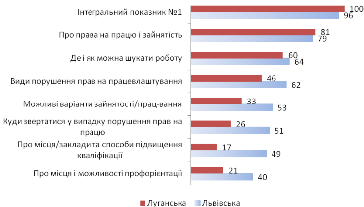
Рис. 3.1. Приріст знань з питань прав на працю та зайнятість молоді з інвалідністю за самооцінками учасників тренінгів, за регіонами, %

За регіонами більш оптимістично оцінили динаміку знань за низкою тем (види порушення прав на працевлаштування і способи їх захисту, можливі види зайнятості, доступ до послуг, пов'язаних із профорієнтацією, підвищенням кваліфікації, перекваліфікацією тощо) львівські учасники. Частково це пов'язано із соціально-демографічними особливостями групи: відносно старшим віком і вищим рівнем освіти, що дало певні переваги у засвоєнні цих тем перед порівняно молодшими і менш освіченими луганськими учасниками. Регіональні розбіжності у відповідях учасників виявляються значно меншими (скорочуються у 1,5–2 рази), коли йдеться про порівняння знань однолітків, наприклад, 17–25-річних респондентів. Проте і в цьому випадку динамічнішим за зазначеними темами виявляється приріст знань у Львівській області (рис. 3.1).